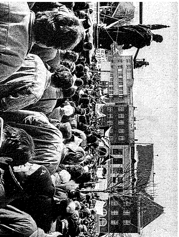
Revoluce 27. listopadu se konala generální stávkou a shromážděním na náměstí Míru (vlevo), lidé se informace dozvídali i na ulicích z letáků ve výlohách.